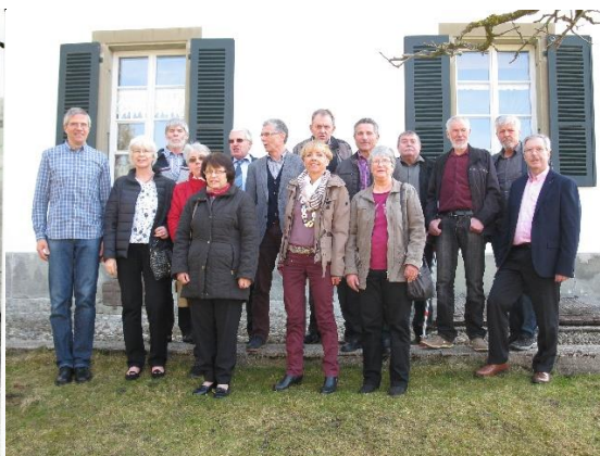
50 Jahre später ...