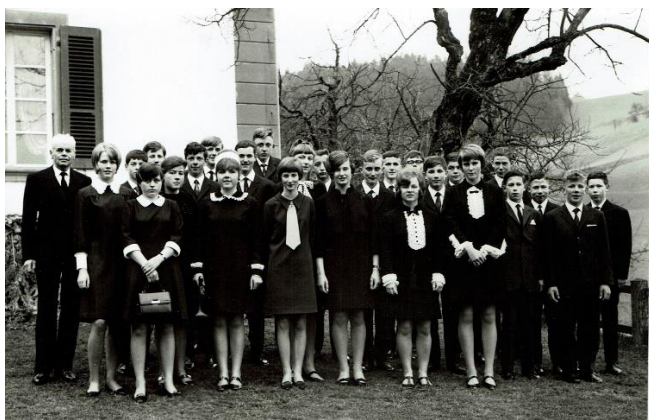
Palmsonntag, 5. April 2018